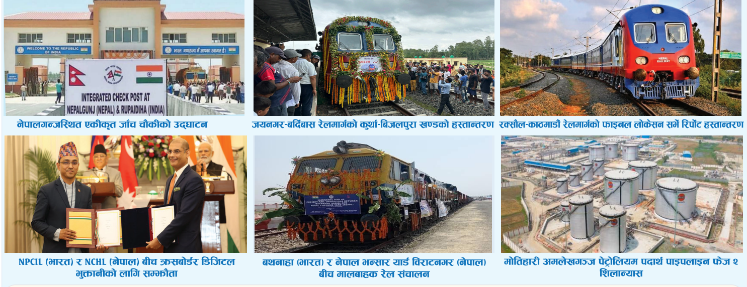
नेपालगन्जस्थित एकीकृत जाँच चौकीको उद्घाटन, जयनगर-बर्दिबास रेलमार्गको कुर्था-बिजलपुरा खण्डको हस्तान्तरण, रक्सौल-काठमाडौं रेलमार्गको फाइनल लोकेसन समे रिपोर्ट हस्तान्तरण, बथनाहा (भारत) र नेपाल भन्सार यार्ड विराटनगर (नेपाल) बीच मालबाहक रेल संजाल, मोतिहारी अमलेखगञ्ज पेट्रोलियम पदार्थ पाइपलाइन फेज २ शिलान्यास