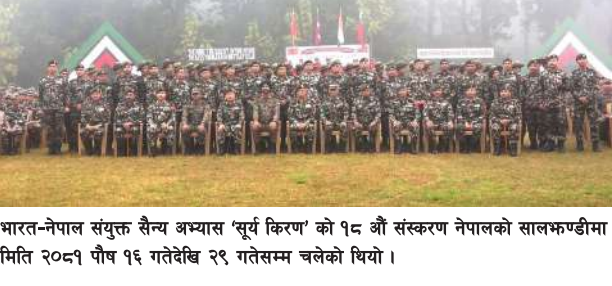
भारत-नेपाल संयुक्त सैन्य अभ्यास 'सुर्य किरण' को १८ औं संस्करण नेपालको सालफण्ड्रीमा मिति २०८१ पौष १६ गतेदेखि २९ गतेसम्म चलेको थियो।