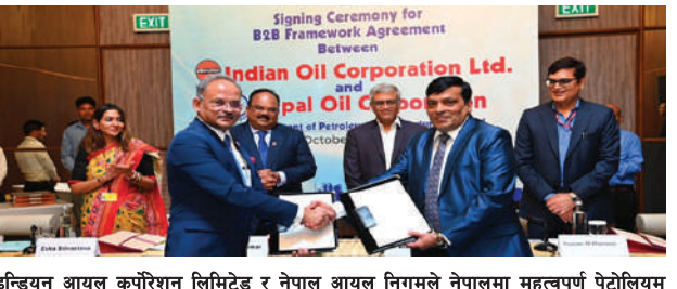
इन्डियन आयल कर्पोरेशन लिमिटेड र नेपाल आयल निगमले नेपालमा महत्वपूर्ण पेट्रोलियम पूर्वाधार परियोजनाहरूको विकासका लागि मार्ग प्रशस्त गर्दै मिति २०८१ आश्विन १७ गते बिजनेस टु बिजनेस फ्रेमवर्क सम्मोहोतामा हस्ताक्षर गरे।