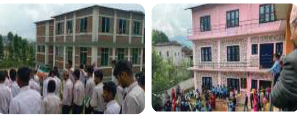
सन् २०२४ मा एचआइसीडीपीहरूको उदघाटन र हस्ताक्षर