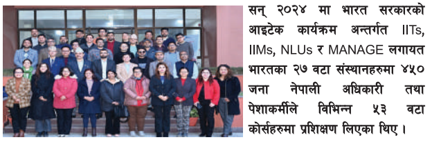
सन् २०२४ मा भारत सरकारको आइटेक कार्यक्रम अन्तर्गत IITs, IIMs, NLUs र MANAGE लगायत भारतका २७ वटा संस्थानहरूमा ५४० जना नेपाली अधिकारी तथा पेशाकर्मिले विभिन्न ५३ वटा कोर्सहरूमा प्रशिक्षण लिएका थिए।