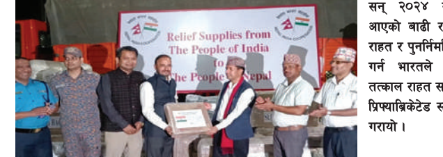
सन् २०२४ सेप्टेम्बरमा नेपालमा आएको बाढी र पहिरोपछि नेपालको राहत र पुनर्निर्माण प्रयासलाई सहयोग गर्न भारतले २५ टनभन्दा बढी तत्काल राहत सामग्रीका साथै दसवटा प्रिफ्याब्रिकेटेड स्टील ब्रिजहरू उपलब्ध गरायो।