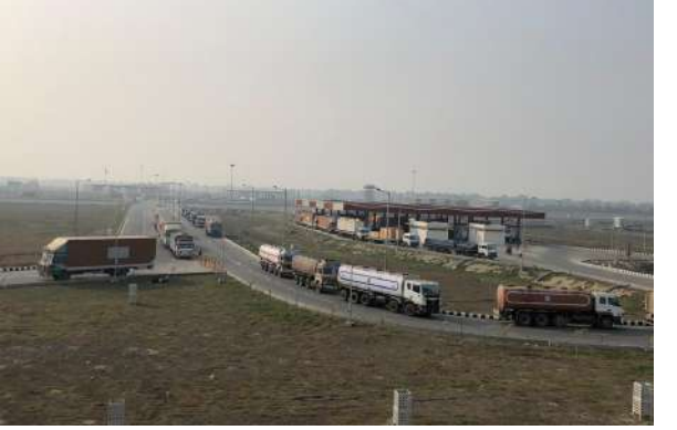
भारतको अनुदान सहयोगमा निर्माण गरिएको नेपालगन्ज (वीरगंज र विराटनगर पछि) स्थित तेस्रो एकीकृत जाँचचौकी (आईसीपी) सन् २०२४ मा सञ्चालनमा आएको थियो। बैरहवास्थित चौथो एकीकृत जाँचचौकी निर्माणाधीन अवस्थामा रहेको छ र दोस्रो चाँदनीस्थित पाँचौं एकीकृत जाँचचौकीको काम छिट्टै सुरु हुने भएको छ।