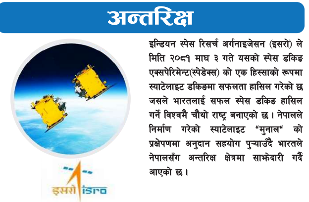
इन्डियन स्पेस रिसेर्च अर्गनाइजेसन (इसरो) ले मिति २०८१ माघ ३ गते यसको स्पेस डकिङ एक्सपेरिमेन्ट(सिडेक्स) को एक हिस्साको रूपमा स्याटेलाइट डकिङमा सफलता हासिल गरेको छ जसले भारतलाई सफल स्पेस डकिङ हासिल गर्ने विश्वकै चौथो राष्ट्र बनाएको छ। नेपालले निर्माण गरेको स्याटेलाइट 'मुनाल' को प्रक्षेपणमा अनुदान सहयोग पुऱ्याउँदै भारतले नेपालसँग अन्तरिक्ष क्षेत्रमा साझेदारी गर्दै आएको छ।