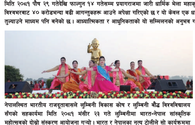
नेपालस्थित भारतीय राजदूतावासले लुम्बिनी विकास कोष र लुम्बिनी बौद्ध विश्वविद्यालयसँगको सहकार्यमा मिति २०८१ मंसिर २३ गते लुम्बिनीमा भारत-नेपाल सांस्कृतिक महोत्सवको दोस्रो संस्करण आयोजना गर्नुभयो। भारत र नेपालका नृत्य टोलीले सो कार्यक्रममा आफ्नो प्रस्तुति प्रस्तुत गरेका थिए। 'भारत र नेपालका बौद्ध सांस्कृतिक सम्पदा' विषयकमा शैक्षिक गोष्ठीको पनि आयोजना गरिएको थियो।