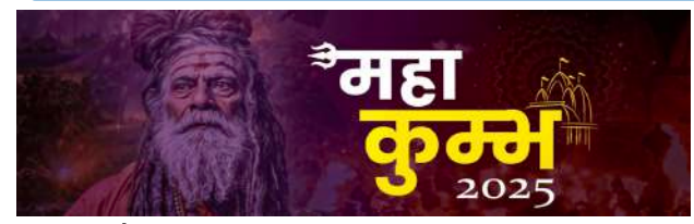
मिति २०८१ पौष २९ गतेदेखि फाल्गुन १४ गतेसम्म प्रयागराजमा जारी धार्मिक मेला महाकुम्भले नेपालबाट ठूलो संख्यामा आगन्तुकहरूलाई आकर्षित गरिरहेको छ। यस धार्मिक मेलाका विश्वभरबाट ४० करोडभन्दा बढी आगन्तुकहरू आउने अपेक्षा गरिएको छ र यो केवल एक धार्मिक कार्यक्रम मात्र नभई आधुनिक प्रविधि र पूर्वाधारलाई जोड्दै भक्तजनहरूको अनुभव सुखद तुल्याउने माध्यम पनि बनेको छ। आध्यात्मिकता र आधुनिकताको यो सम्मिलनको अनुभव गर्न महाकुम्भको भ्रमण गर्न सकिन्छ।