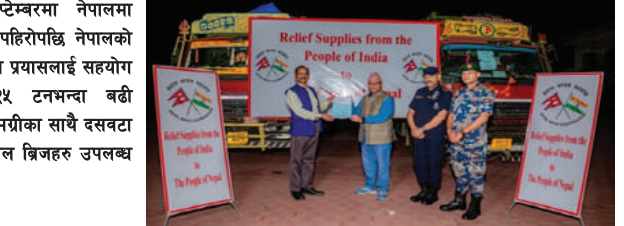
सन् २०२४ सेप्टेम्बरमा नेपालमा आएको बाढी र पहिरोपछि नेपालको राहत र पुनर्निर्माण प्रयासलाई सहयोग गर्न भारतले २५ टनभन्दा बढी तत्काल राहत सामग्रीका साथै दसवटा प्रिफ्याब्रिकेटेड स्टील ब्रिजहरू उपलब्ध गरायो।