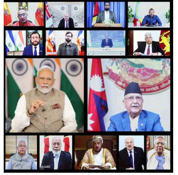
नेपालका सम्माननीय प्रधानमन्त्री श्री केपी शर्मा ओलीले मिति २०८१ आश्विन ३० गते भारतले आयोजना गरेको तेस्रो भ्वाइस अफ ग्लोबल साउथ शिखर सम्मेलनमा सहभागीता जनाउनुभयो।