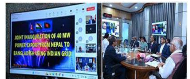
भारतीय पिडमार्फत नेपालबाट बंगलादेशतर्फ हुने पहिलो विद्युत व्यापारको मिति २०८१ कार्तिक ३० गते उदघाटन गरियो।