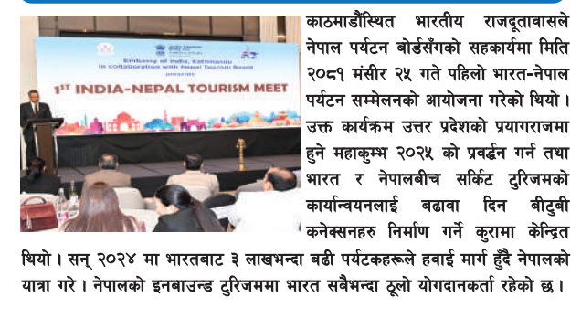
काठमाडौंस्थित भारतीय राजदूतावासले नेपाल पर्यटन बोर्डसँगको सहकार्यमा मिति २०८१ मंसिर २५ गते पहिलो भारत-नेपाल पर्यटन सम्मेलनको आयोजना गरेको थियो। उक्त कार्यक्रम उत्तर प्रदेशको प्रयागराजमा हुने महाकुम्भ २०२५ को प्रबर्द्धन गर्न तथा भारत र नेपालबीच सकिँदै टुरिजमको कार्यान्वयनलाई बढावा दिन बीटुडी 'कनेक्सन' निर्माण गर्ने कुरामा केन्द्रित थियो। सन् २०२४ मा भारतबाट ३ लाखभन्दा बढी पर्यटकहरूले हवाई मार्ग हुँदै नेपालको यात्रा गरे। नेपालको इनबाउन्ड टुरिजममा भारत सबैभन्दा ठूलो योगदानकर्ता रहेको छ।