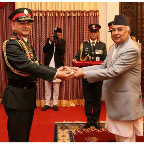
भारतीय सेना प्रमुख जनरल उपेन्द्र द्विवेदी, पीपीएसएम, एपीएसएमले मिति २०८१ मंसिर ५ गतेदेखि ९ गतेसम्म नेपालको भ्रमण गर्नुभयो। नेपालका सम्माननीय राष्ट्रपतिले बर्होलाई नेपाली सेनाको मानार्थ महारथी दर्ज्यानी चिन्ह प्रदान गर्नुभयो। त्यसपछि सुप्रबल जनसेवाश्री पदकबाट विभूषित नेपाली सेनाका प्रधान सेनापति महारथी अशोक राज सिग्देलले मिति २०८१ मंसिर २६ गतेदेखि २९ गतेसम्म भारतको भ्रमण गर्नुभयो। भारतका माननीय राष्ट्रपतिले बर्होलाई भारतीय सेनाको मानार्थ महारथीको दर्ज्यानी चिन्ह प्रदान गर्नुभएको थियो।