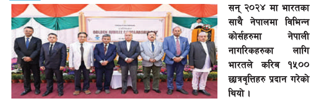
सन् २०२४ मा भारतका साथै नेपालमा विभिन्न कोर्सहरूमा नेपाली नागरिकहरूका लागि भारतले करिब १५०० छात्रवृत्तिहरू प्रदान गरेको थियो।